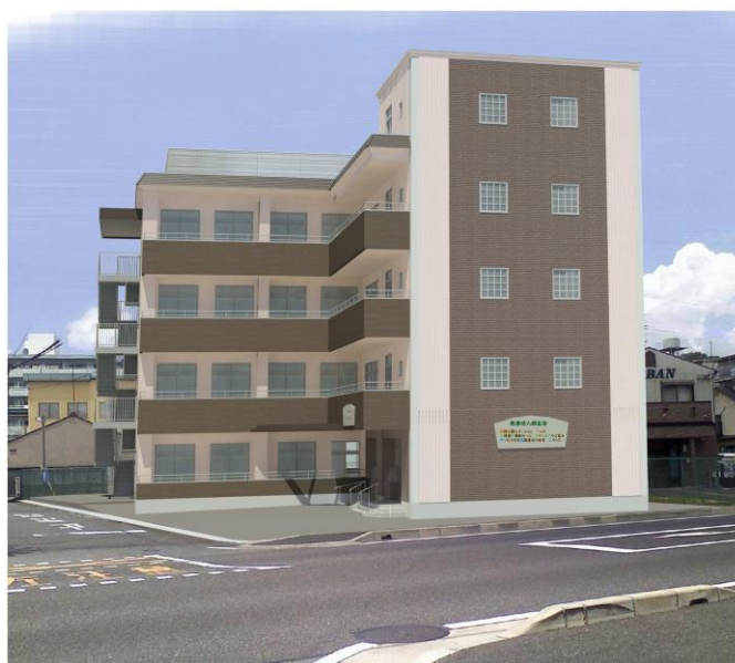
小規模多機能型居宅介護グリーンガラス富士

〒520-0822 大津市秋葉台 13 番 5 号 ☎(077)533-2100